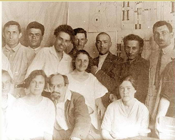
Лев Семенович Выготский среди коллег.